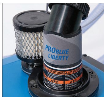
Klebstoffbefüllschlauch und Luftfilter